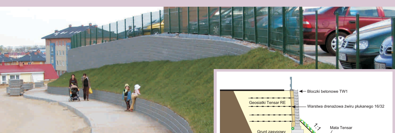
Przykład zastosowania nr ref. 60